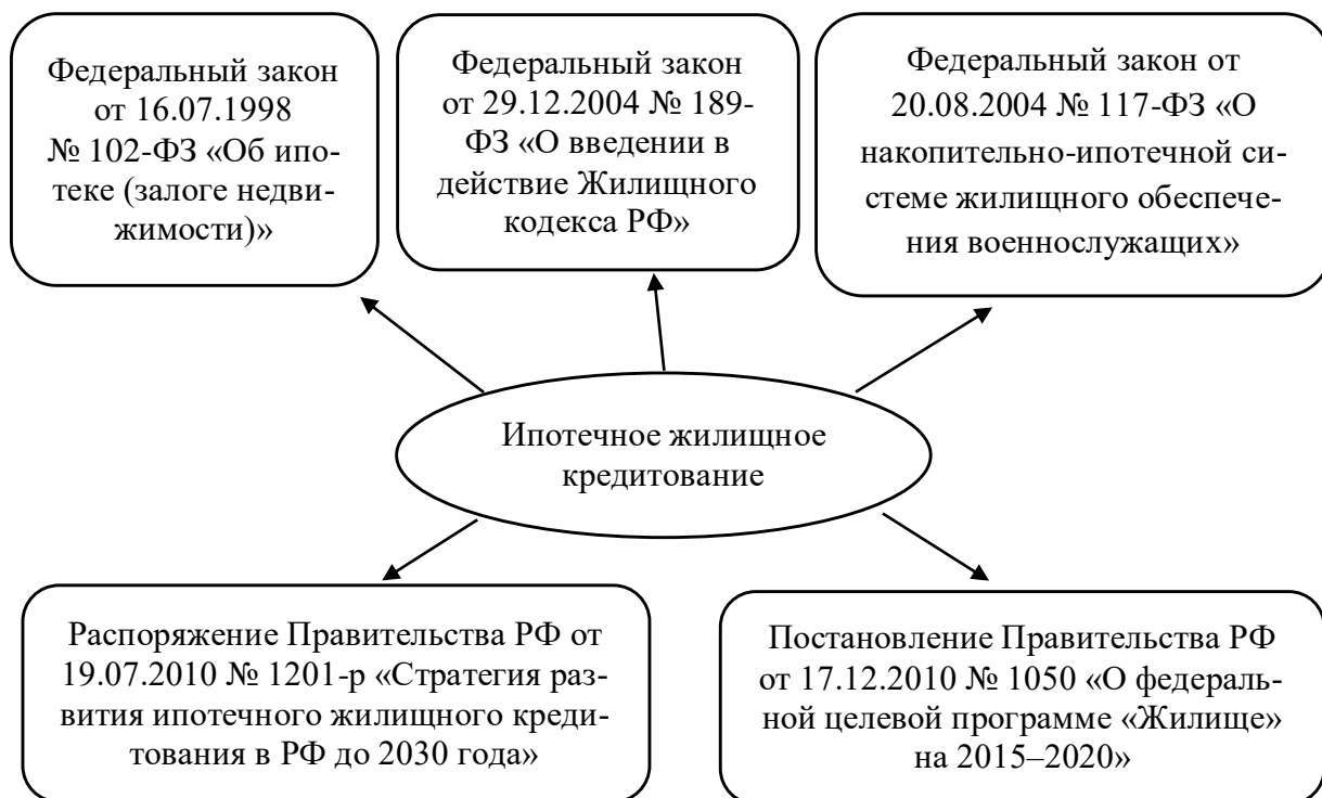
Рис. 1.2. Законодательная и нормативная база регулирования ИЖК*